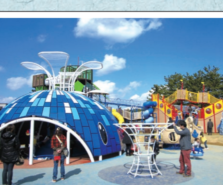
③宝くじ遊園「霞★ゆめくじら」

⑦霞ヶ浦競馬場跡 今の競輪場は昭和4年から途中中止を経ながらも昭和25年まで霞ヶ浦競馬場として親しまれていました。この馬頭観音の碑は馬の供養碑です。