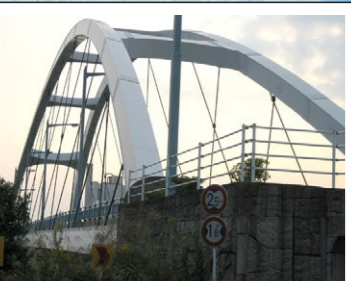
⑰霞ヶ浦パークブリッジ

●四日市港ポートビル 【開館時間】 10:00～17:00 土日祝は21:00まで 【休館日】毎週水曜日(祝日除く) 【電話】059-366-7022