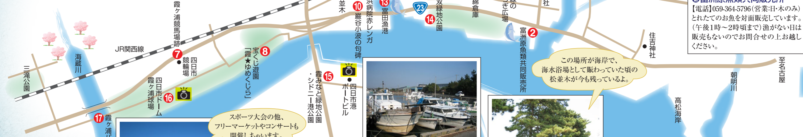
⑧宝くじ遊園「霞★ゆめくじら」

⑦霞ヶ浦競馬場跡 今の競輪場は昭和4年から途中中止を経ながらも昭和25年まで霞ヶ浦競馬場として親しまれていました。この馬頭観音の碑は馬の供養碑です。