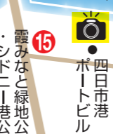
⑮四日市港ポートビル

26,000㎡の広々とした芝生広場や海水を利用した滝・せせらぎが整備されており、散歩をするも潮風が気持ちいい海に面した公園です。