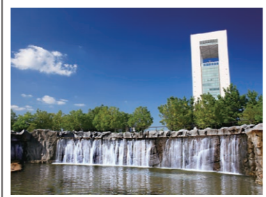
⑮四日市港ポートビルと霞みなど緑地公園・シドニー港公園

ポートビル展望展示室「うみてらす14」からは四日市を360度見渡せます。すぐ手前にはアスレチック遊具や池のある2つの公園があります。