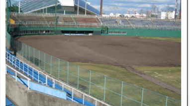
⑯四日市ドーム・霞ヶ浦球場

●四日市港ポートビル 【開館時間】 10:00～17:00 土日祝は21:00まで 【休館日】毎週水曜日(祝日除く) 【電話】059-366-7022