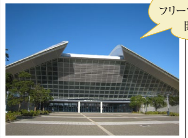
⑯四日市ドーム・霞ヶ浦球場

ポートビル展望展示室「うみてらす14」からは四日市を360度見渡せます。すぐ手前にはアスレチック遊具や池のある2つの公園があります。