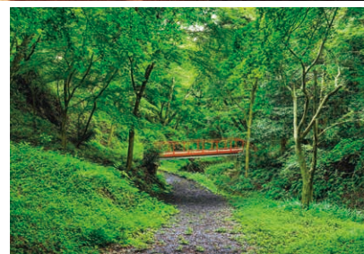
▲紅葉の名所だが、新緑もおススメ