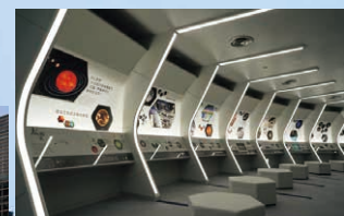
宇宙からの視点で地球を観察できるコスミックギャラリー