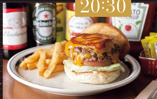
ダブルチーズバーガー1950円、ポテト230円。パンズにパテ、野菜とソースの四重奏を味わって

☎059-325-6690 ④四日市市浜田町5-3 グリーンス四日市ビル1F ⑤11:00~15:00(LO 14:30)、17:00~22:00(LO 21:00)※土・日曜は11:00~22:00(LO 21:00) ⑥無休 ⑦なし ⑧近鉄四日市駅南口から徒歩2分 [MAP●P12 E5]