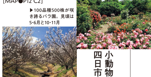
▶100品種500株が咲き誇るバラ園。見頃は5-6月と10-11月