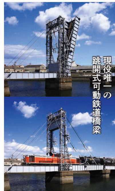
▲橋脚上に立つ高さ15.6mの鉄塔頂部からワイヤで巻き取り、桁を80度に跳ね上げる。国の重要文化財