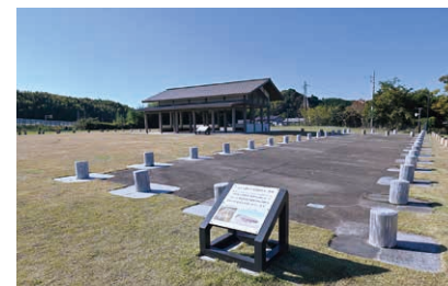
▲市街地を見下ろす小高い丘に広がっている