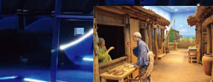
住居や町の様子を原寸大で再現した時空街道