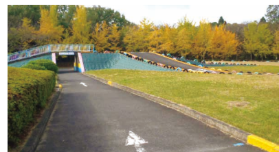
▲適度なアップダウンのモトクロスコースで運動不足解消