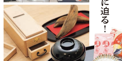
▲本物のかつお節を削ってみよう