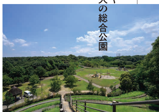
▲展望の小山のふもとに大型遊具の広場がある