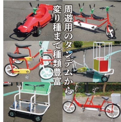
▲変り種自転車は、3歳以上30分400円・タンデム自転車は1時間600円