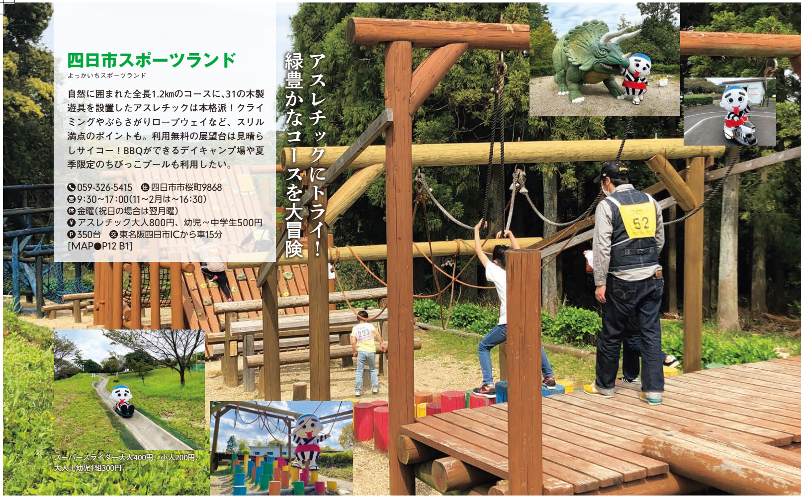
スノーバズライダー大人400円、小人200円、大人+幼児1組300円