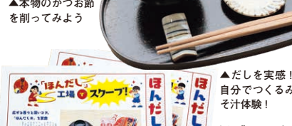
▲だしを堪能！自分でつくるみそ汁体験！