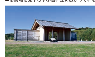
▲正面東門を復元した「八脚門・櫓」