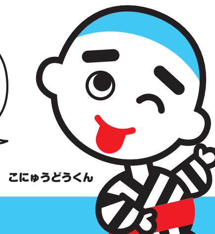
こにゅうどうくん